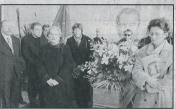
La famille et les proches autour du cercueil.