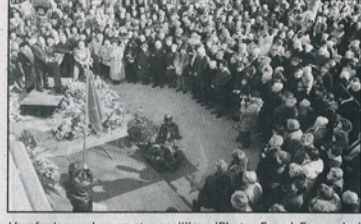
Une foule nombreuse et recueillie.