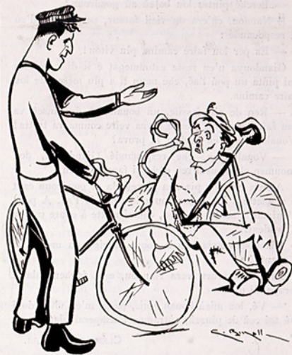
— As pa vist, espessa de cougourda, che aï sourit lou bras pèr vira !!!

« Avan, si calignavou ounestamen e lou mariage courounava lou calignatori. Ahura, si