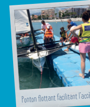
Ponton flottant facilitant l'accès

Activités voile et kayak gratuites pour les personnes en situation de handicap et leur famille