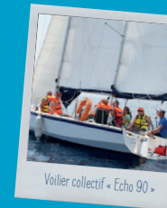
Voilier collectif « Echo 90 »

• CANNES vendredi 5 et samedi 6 juillet Handiplage Bijou plage