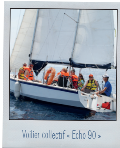
Voilier collectif « Echo 90 »

• Ce voilier collectif à deux mâts également inchavirable et ce, grâce à sa quille, permet d'accueillir à son bord 12 personnes au total dont les deux moniteurs. Deux personnes en fauteuil manuel* pourront monter à bord par l'arrière du bateau à l'aide d'une passerelle. Si vous le souhaitez vous pourrez participer à toutes les manœuvres et notamment prendre la barre de ce navire.