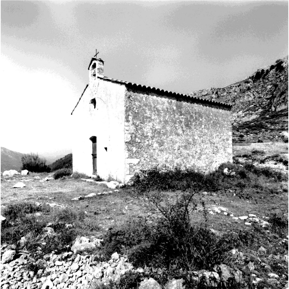
Fig. 77. Vue d'ensemble depuis l'est