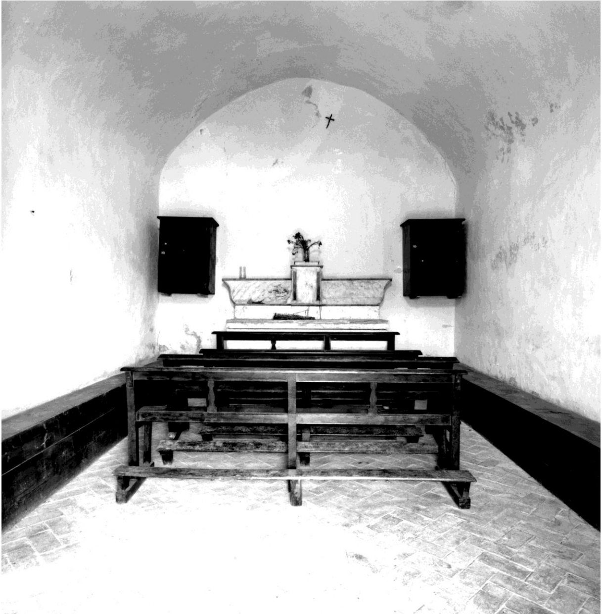
Fig. 78. Vue intérieure depuis le sud-est