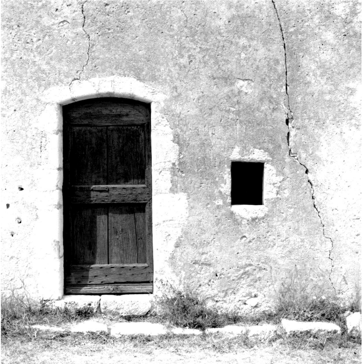
Fig. 81. La façade, vue depuis le sud-est, détail : la porte Référence : 17Fi4424