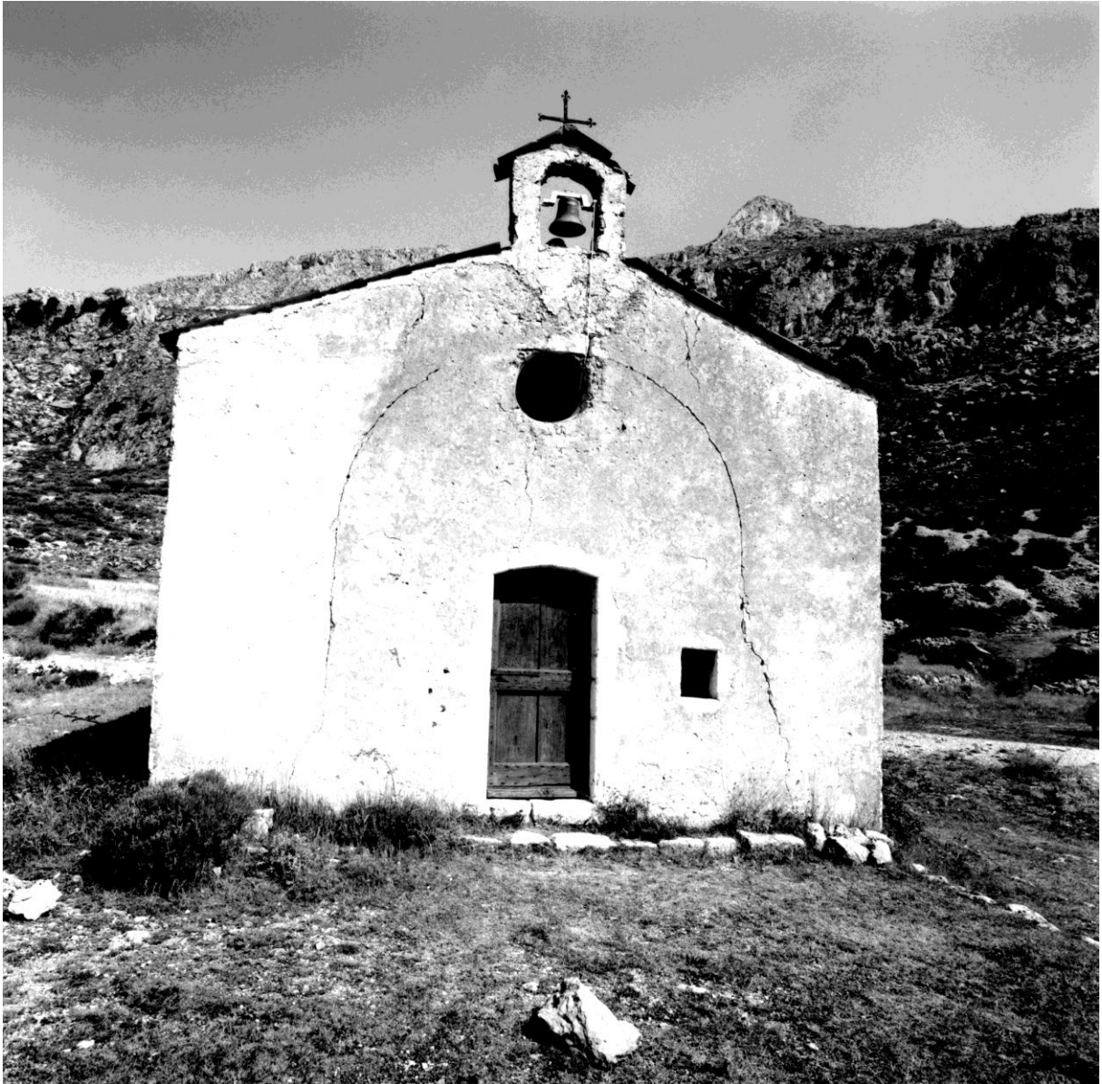
Fig. 79. La façade, vue depuis le sud-est © Conseil général des Alpes-Maritimes, inventaire du patrimoine culturel, M. Graniou, 1995 Référence : 17Fi4423