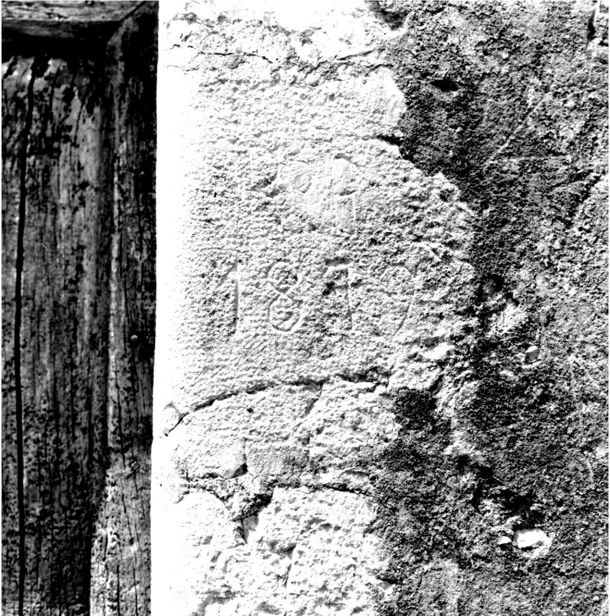
Fig. 82. La façade, vue depuis le sud-est, détail : pierre d'un piédroit de la porte reprise à la boucharde et datée