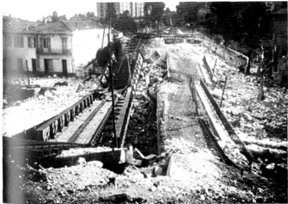
Les viaducs du Borrigo effondrés après leur destruction par le Génie français