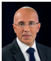
Eric Ciotti Député Président du Département des Alpes-Maritimes

Je souhaite que le colloque contribue à mettre en perspective la construction historique de la frontière, sa gestion et la trajectoire de celles et ceux qui la franchissent entre 1760 et 1947.