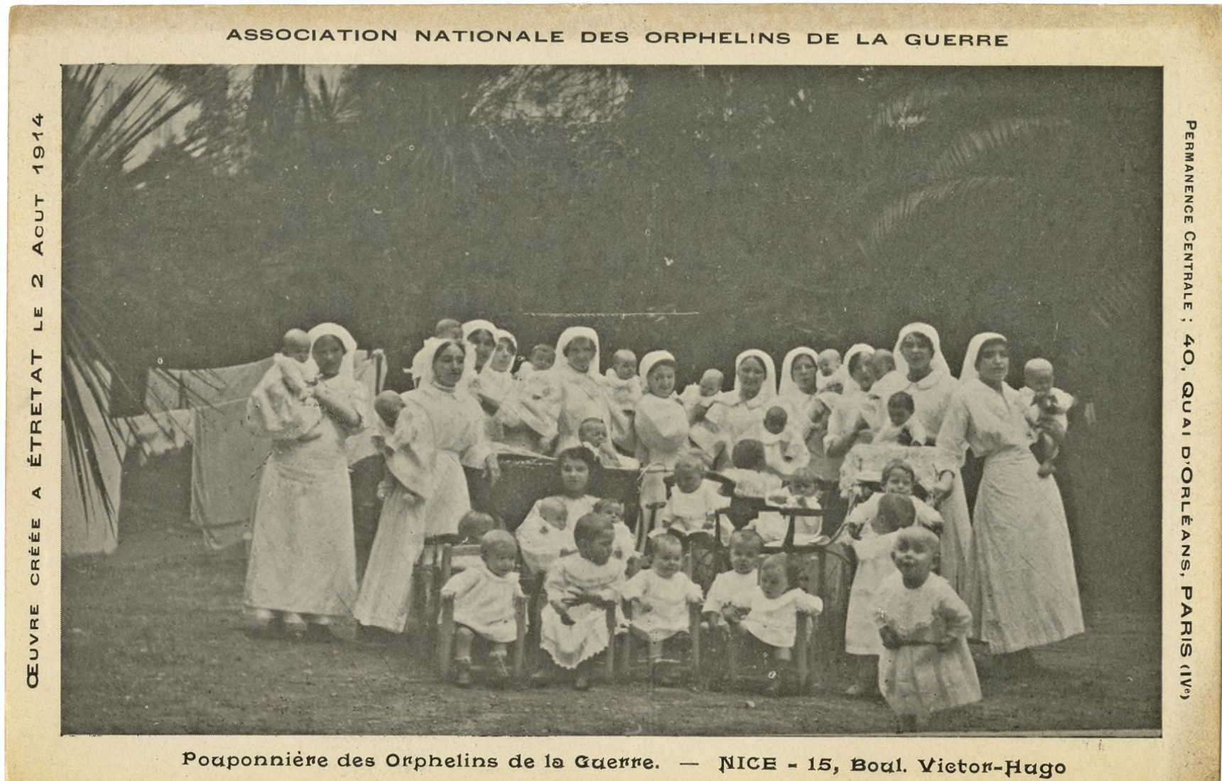
1.8 Pouponnière d'orphelins de la guerre à Nice, s. d. Arch. dép. Alpes-Maritimes, 2 Fi 1205.