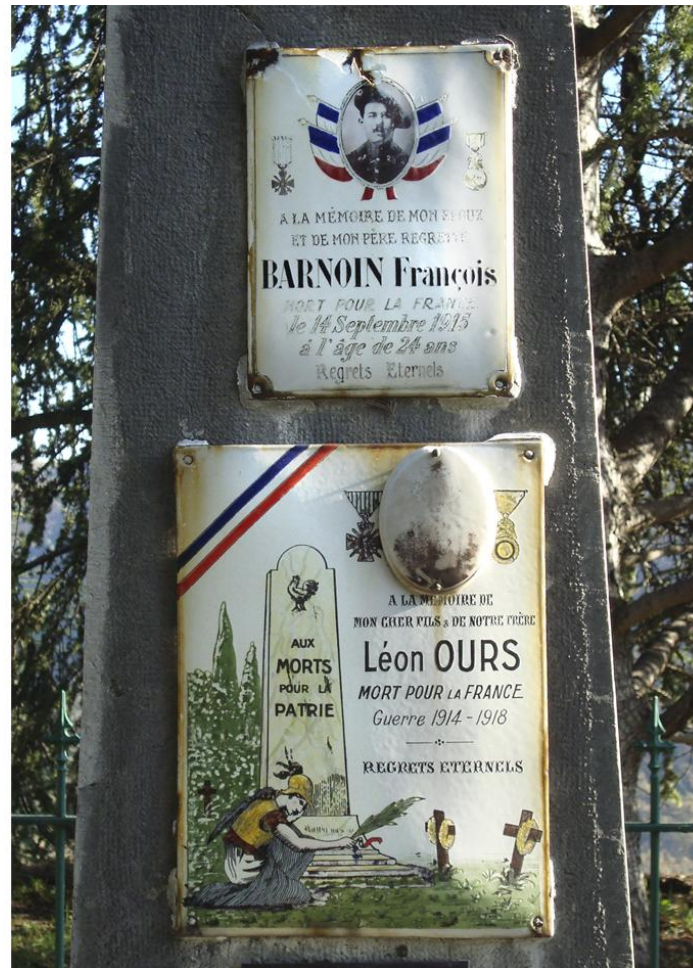
1.4 Plaques commémoratives des villages de Clans et de Bouyon.