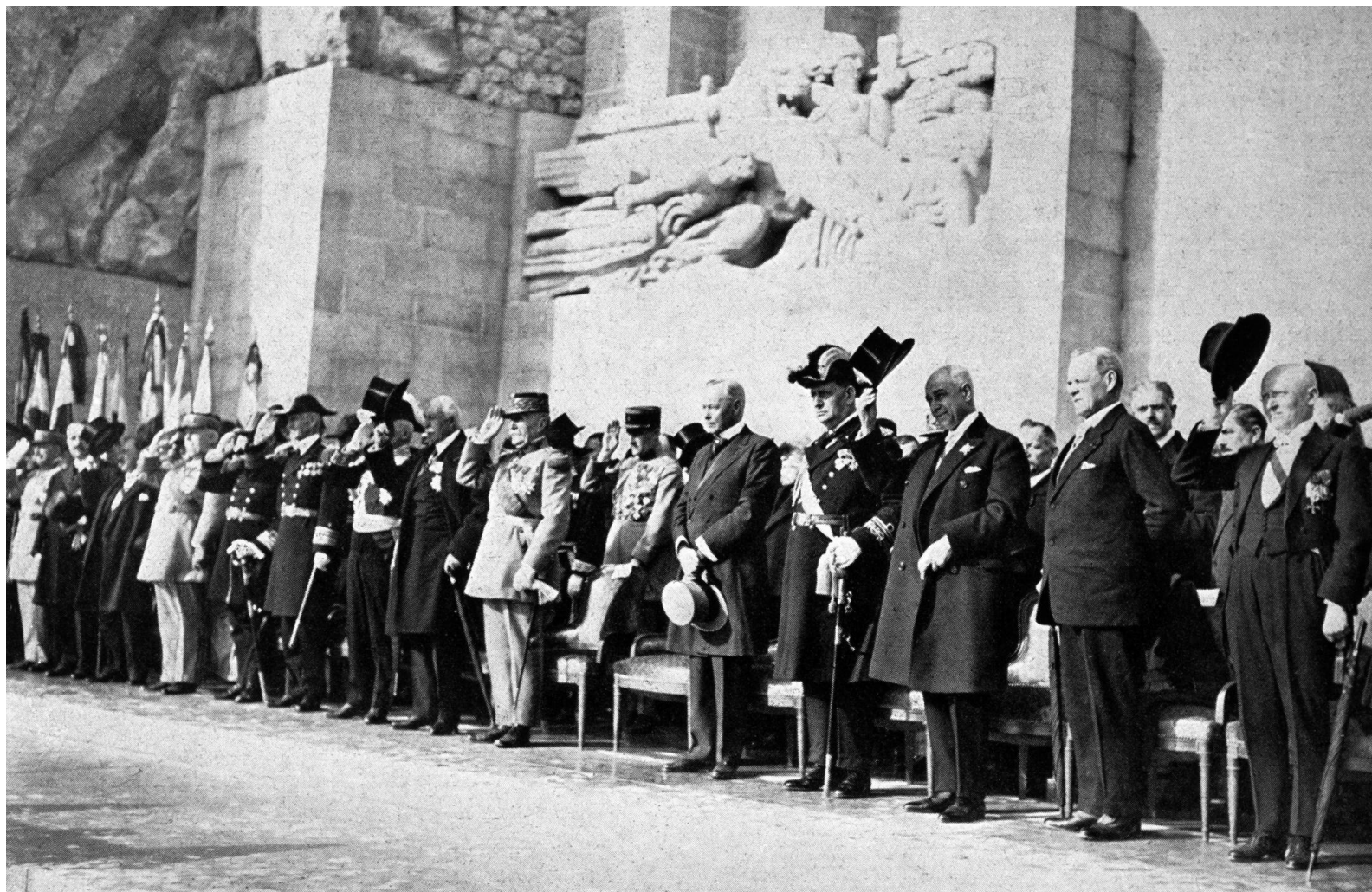
1.1 Visite du Président de la République Paul Deschanel, à Nice. L'Éclairer de Nice, 6 avril 1920.