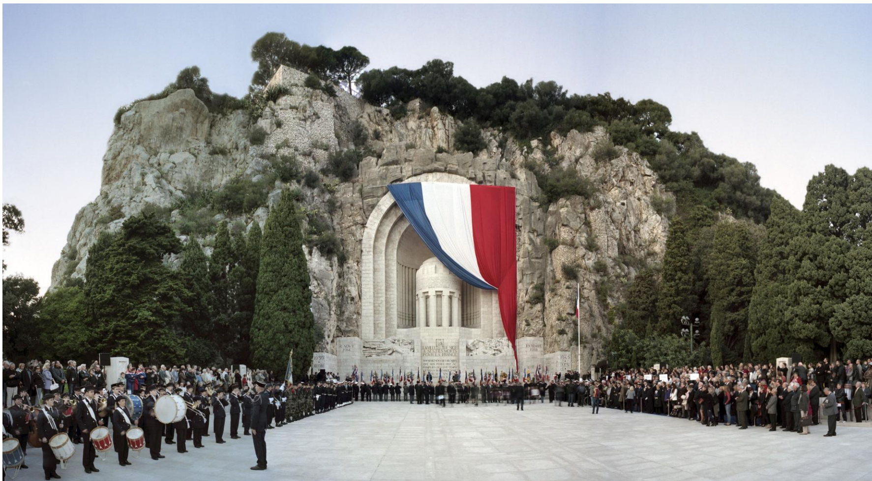
1.6 Cérémonie du 11 novembre 2011 au monument aux morts de la ville de Nice.