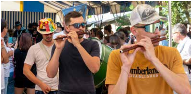
Animation musicale au fifre