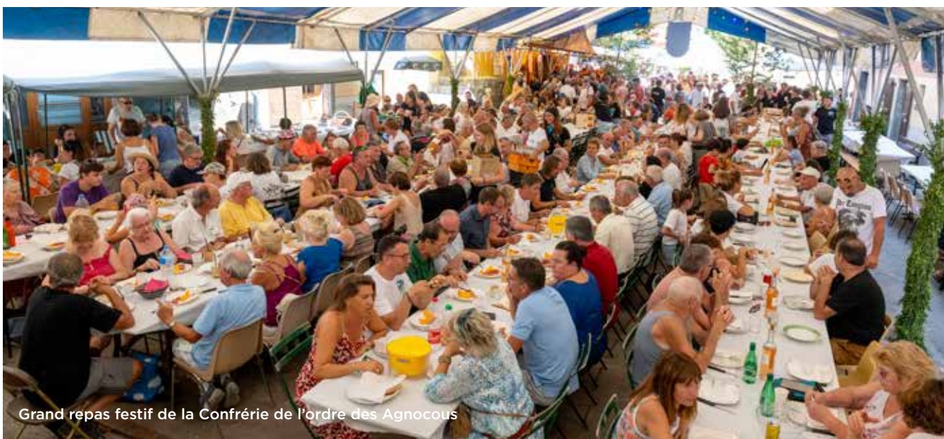
Grand repas festif de la Confrérie de l'ordre des Agnocous