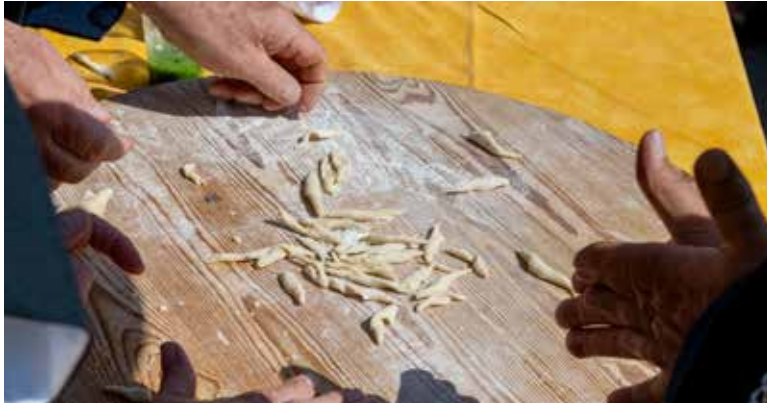
Confection des Agnocous