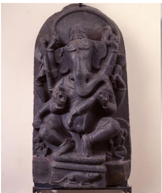
Ganesh, chlorite, 10e siècle, Inde.

Cette scène représente le nue, être maléfique. Une légende raconte que l'empereur Konoé tomba malade après qu'un nue s'installa au sommet du palais en 1153. Le samouraï Minamoto no Yorimasa le tua à coup de flèches et l'empereur guérit.