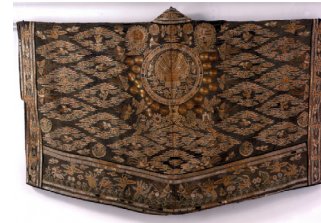
Robe de prêtre taoïste, satin, soie, fils d'or et d'argent, 18e siècle, Chine.

L'oni a une tête, des bras et des jambes mais mesure au moins 3 mètres de haut. Sa peau est rouge, bleu, noir ou jaune. Il porte des cornes et ses dents sont des crocs. Les oni représentent le mal donc il vaut mieux éviter de les croiser.