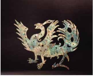
Plaque de cercueil, bronze, 916-1125, Chine.

Le phénix est un animal mythologique. On dit qu'il possède le corps d'un faisán et le plumage d'un paon. Oiseau aux cinq couleurs, il est le symbole de l'impératrice et gardien du Sud. Il ne semble paraître qu'en temps de paix.