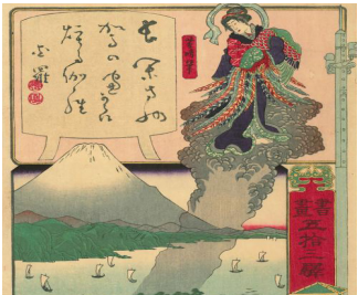
Histoire du pin de Miho et du manteau de plumes, estampe, 1872, Japon.

Le phénix est un animal mythologique. On dit qu'il possède le corps d'un faisán et le plumage d'un paon. Oiseau aux cinq couleurs, il est le symbole de l'impératrice et gardien du Sud. Il ne semble paraître qu'en temps de paix.