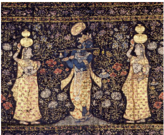
Krishna et les bouvières, peinture sur coton, 18e siècle, Inde.

Bouleversée par la beauté du paysage, Haragamo, être céleste, enlève sa robe à plumes. Un pêcheur nommé Hakuryo prend sa robe et refuse de la lui rendre jusqu'à ce qu'elle exécute une danse.