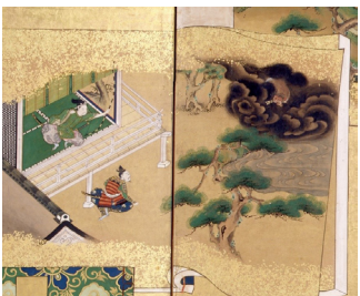
Paravent, 18e siècle, Japon.

Cette peinture dépeint les amours du dieu Krishna. Reconnaisable à sa peau bleue, Krishna est la 8ème incarnation du dieu Vishnou.