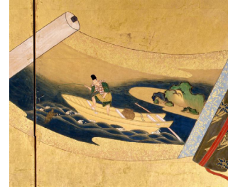
Paravent, 18e siècle, Japon.

Le taoïsme est une religion chinoise ancienne. Les losanges présents sur la robe, sont constitués de nuages assemblés, grand thème du répertoire décoratifs chinois, représentant l'énergie Qi.