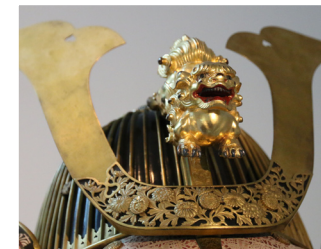
Casque de samouraï, 1850, Japon.

Cette scène représente l'histoire d'Urashima, pêcheur. Après avoir sauvé une tortue, celle-ci se transforma en princesse et l'emena dans son palais. De retour sur terre, des centaines d'années avaient passé.