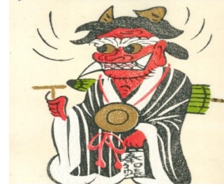
Oni, estampe, Japon.

Ganesh est représenté dansant avec 8 bras. Il est né de la volonté de sa mère Parvati. Chargé de garder la maison, il ne laisse pas rentrer Shiva, mari de Parvati, qu'il ne connaît pas. Enragé, Shiva lui fit perdre sa tête mais pour réparer sa faute, lui donna la tête de la première créature qui passa: un éléphant. Sur le socle, sa monture, le rat Mushika.