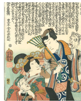
Ume no Haru, estampe, 19e siècle, Japon.

Sur ce casque de samouraï figure un shishi (chien-lion) en bois laqué or. Importé de Chine, le shishi prend souvent le nom de Komainu au Japon. On les trouve fréquemment sculptés à l'entrée des temples car ils ont une vertu protectrice.