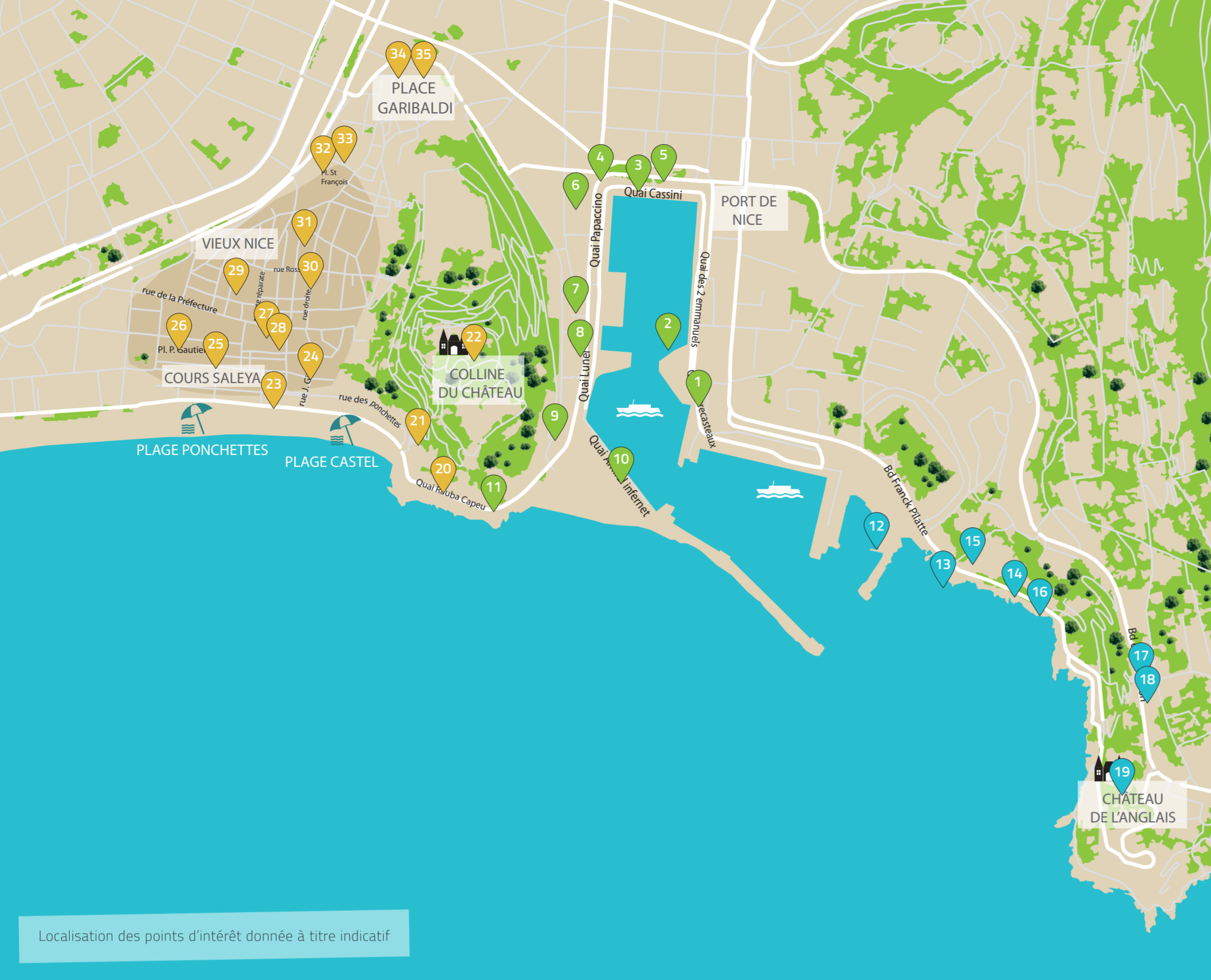
Localisation des points d'intérêt donnée à titre indicatif