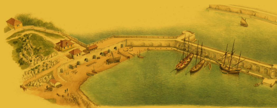
Illustration : Les Magasins du carénage en 1787, aquarelle de Jean-Benoît Héron, 2017

En 2009 puis 2012, les différentes parties du bâtiment sont acquises par le conseil général des Alpes-Maritimes puis soigneusement restaurées pour réaliser un espace culturel départemental, la Galerie Lympia, ouvert depuis le 4 février 2017.