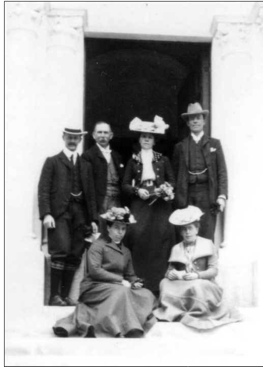
L'église de Tous les Saints à Valescure et la chorale de l'église vers 1902 (Collection G. Gurrey)