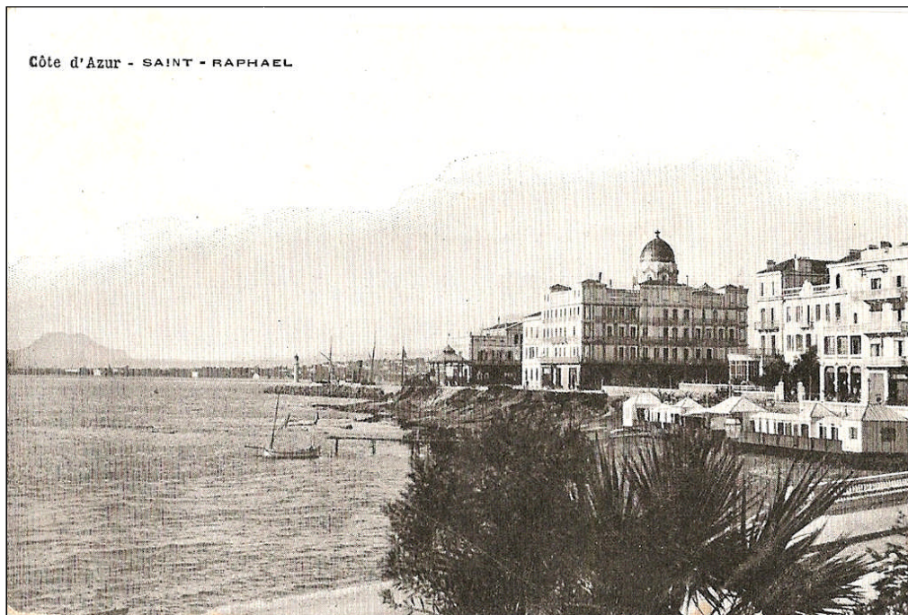
Le front de mer de Saint Raphaël. La photo est antérieure à 1890