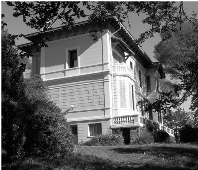
Les Colombes Grises

La villa des Asphodèles, la villa voisine Les Colombes Grises, construite pour le colonel Call, celle des Genévriers 18 bâtie pour Lord Rendel, et Clair Bois 19 conçue pour George Nelson Hector illustrent ce style architectural particulier. Elles témoignent encore de nos jours de l'ancienne implantation de l'aristocratie anglaise à Valescure.