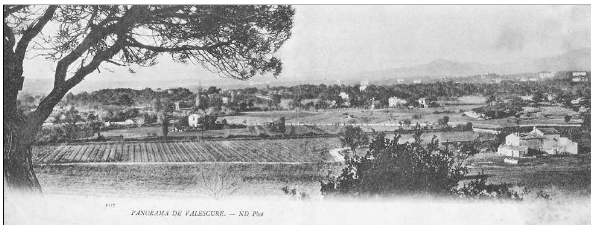
Valescure dans les pins au pied de l'Estérel avant 1900

Félix Martin était administrateur de plusieurs sociétés foncières, notamment de la Société Civile de Saint-Raphaël-Valescure. Cette société a fait la promotion commerciale des terrains sur lesquels se sont faites les constructions marquantes du développement de Valescure.